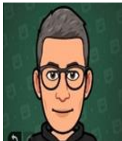
Franck Consultant Ingénieur Sélection